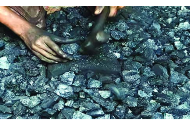
విద్యుత్ ప్రాంతీక వేసవి సెలల్లో అధిక పరిమాణంలో బొగ్గు అవసరం ఉంటుంది.

జరుగుతోంది. దేశీయంగా నాణ్యమైన బొగ్గు లభిస్తున్నందున, ఇబ్బందులేమీ ఉండవని విద్యుత్ ప్రాంతీక ప్రభుత్వం వివరిస్తున్నట్లు నమావారం. వేసవి కోసం బొగ్గు సరఫరా పెంపు..కోల్ ఇండియా: వేసవిలో విద్యుత్ వాడకం పెరుగుతుంది కాబట్టి, అదనపు విద్యుత్తు ఉత్పత్తి చేసేలా ప్రాంతీక బొగ్గు సరఫరా పెంచే పనిలో ఉన్నట్లు కోల్ ఇండియా తెలిపింది. ఈనెల 25 నాటికి కంపెనీ వద్ద 115 మిలియన్ టన్నుల బొగ్గు ఉంది. మార్చి 31 నాటికి ఇది మరింత పెరగనుంది. విద్యుత్ ప్రాంతీక వద్ద 55 మి. టన్నుల బొగ్గు సహా ఇతరత్రా గూడ్స్ షెడ్యూ, వాషరీలు, పోర్టులతో కలిపి మొత్తం 175.5 మి. టన్నుల నిల్వలున్నాయి. అవసరం ఉంటుంది.