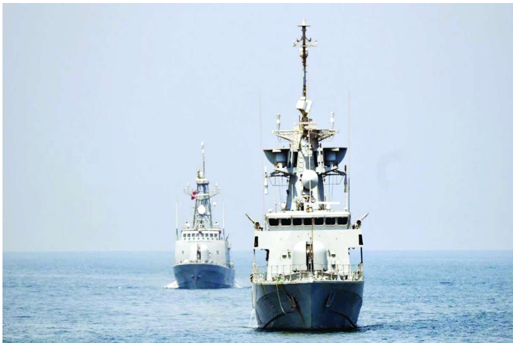
(డీజిఎస్) నిరంతరం షిప్పింగ్ కంపెనీలతో టవీల్ ఉంటూ నౌకల కదలికలను బ్రాక్ చేస్తుంది. నావికుల కుటుంబాల కోసం ప్రత్యేక హెల్ప్ లైన్ సంబంధం ఏర్పాటు చేయడం అండ్ షిప్ మెంట్ సర్వీస్ లైన్ (ఆర్.ఎల్.ఎస్) అందుబాటులోకి తెచ్చారు.

పశ్చిమ ఆసియాలో అమెరికా, ఇజ్రాయేల్- ఇరాన్ మధ్య ఢిక్కర యుద్ధం కొనసాగుతోంది. ప్రపంచ రవాణా కీలకమైన హార్బుజ్ జలసంధి మూతపడటంతో అంతర్జాతీయ షిప్పింగ్ మార్గాల్లో రవాణాకు తీవ్ర అంతరాయం ఏర్పడింది. పర్షియన్ గల్ఫ్, ఒమన్ గల్ఫ్ ప్రాంతాల్లో సుమారు 37 భారత నౌకలు నిలిచిపోయాయి. వీటిలో 1,109 మంది నావికులు ఉన్నట్లు కేంద్ర వర్గాలు తెలిపారు. వీటిలో కొన్ని నౌకలు ముడి చమురు, నౌకాని ఇంధనం, పోస్ట్-ఎలెక్ట్రానిక్ రవాణా చేస్తున్నాయి. మరికొన్ని గల్ఫ్ దేశాల నుంచి పెట్రోలియం ఉత్పత్తులను తీసుకొచ్చేందుకు వెళ్తున్నాయి. కాగా, హార్బుజ్ జలసంధి మూసివేయడంతో రవాణాకు పూర్తిగా అంతరాయం కలిగింది. ఈ నేపథ్యంలో, డైరెక్టరేట్ జనరల్ ఆఫ్ షిప్పింగ్ ఆయా కంపెనీలతో క్రమం తప్పకుండా సంప్రదింపులు జరుపుతూ పరిస్థితిని సమీక్షిస్తోంది. భారతీయ నావికుల భద్రతపై ప్రత్యేక దృష్టి పెట్టినట్లు అధికార వర్గాలు పేర్కొన్నాయి. ఇటీవల పశ్చిమ ఆసియాలో తలెత్తిన ఘర్షణల కారణంగా ముగ్గురు భారతీయ నావికులు మరణించారు. భారత్ తన చమురు అవసరాలల్లో ఎక్కువ భాగం గల్ఫ్ దేశాల నుంచే దిగుమతి చేసుకుంటుంది. ఈ క్రమంలో పర్షియన్ గల్ఫ్, ఒమన్ గల్ఫ్ ప్రాంతాల్లో చిక్కుకుపోయిన 37 నౌకల్లో అత్యధిక శాతం ముడి చమురును, ఎల్?ఎన్?జీని తీసుకొస్తున్నాయి. మరికొన్ని నౌకలు పెట్రోలియం ఉత్పత్తులను తీసుకురావడానికి గల్ఫ్ దేశాల వైపు వెళ్తుండగా మధ్యలోనే నిలిచిపోయాయి. ఈ నౌకల రాకపోకలు అగిపోవడం వల్ల రాబోయే రోజుల్లో దేశీయంగా ఇంధన ధరలపై ప్రభావం పడే అవకాశం ఉందన్న ఆందోళనలు వ్యక్తమవుతున్నాయి.