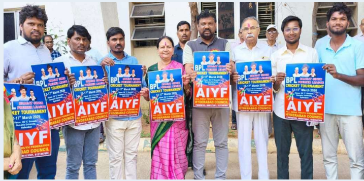
ప్రతిఘటన, హైదరాబాద్ జ్యూరో ప్రతినిధి