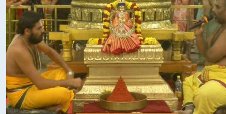
ప్రతిఘటన, యాదాద్రి భువనగిరి జిల్లా బ్యారో జెంగిలీ రవీందర్

స్వర్ణగిరి శ్రీ వేంకటేశ్వర స్వామి ఆలయంలో శుక్రవారం శ్రీ పద్మావతి అమ్మవారికి సహస్ర కుంకుమార్చన సేవ అర్చక స్వాములు ఘనంగా నిర్వహించారు. ఆలయంలో సుప్రభాత సేవతో మొదలుకొని నిత్య కైంకర్యాలు జరిగాయి. సహస్ర నామార్చన సేవతో పాటు లోక కళ్యాణం కోసం అర్చక స్వాములు శ్రీ సుధర్మ నారసింహ హవనంను నిర్వహించారు. స్వామివారి నిత్య కళ్యాణం మహోత్సవాన్ని శ్రీవారి వైభవోత్సవ మండపంలో వేదమంత్రాలతో మంగళ ధ్వజం మధ్య అంగరంగ వైభవంగా నిర్వహించారు. భక్తులు శ్రీ స్వామివారి కల్యాణ మహోత్సవాన్ని తిలకించి ఆనంద పరచు లైనారు. సాయంత్రం శ్రీ స్వామివారి తిరువీధి ఉత్సవ సేవను ఘనంగా నిర్వహించారు. తిరువీధి ఉత్సవ సేవ అనంతరం శ్రీ వేంకటేశ్వర స్వామి వారు దేవీవ్యూహంగా వెలుగుతున్న సహస్రదీప కాంతుల మధ్య ఊయలలో ఆసీనులై భక్తులకు దర్శనమిచ్చారు. అర్చక స్వాములు వేదమంత్రోచ్ఛారణలతో శ్రీ స్వామివారిని ఆర్పించి కర్పూర మంగళహారతులు సమర్పించారు. భక్తులు నయనానందకరంగా శ్రీవారిని దర్శించుకున్నారు.