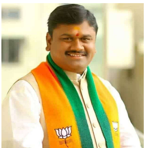
ప్రతిఘటన, ఎన్టీసీ నగర ప్రతినిధి

డివిజన్ లో విచ్చలవిడిగా కొనసాగుతున్న షెటర్ల నిర్మాణానికి అండదండగా నిలుస్తున్న మాజీ తాజా కార్పొరేటర్ భర్త..!!