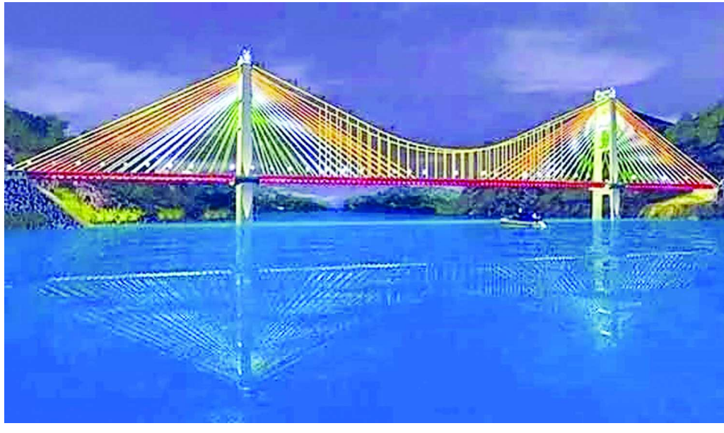
తెలుగు రాష్ట్రాలలోని ప్రజలు రాకపోకలు కొనసాగించే విధంగా రవాణా వ్యవస్థను మెరుగుపరిచే విధంగా శరవేగంగా అడుగులు ముందుకేస్తున్నట్లు తెలుస్తుంది.

నాగర్ కర్నూల్ జిల్లా పరిధిలోని కొల్లూపూర్ అసెంబ్లీ నియోజకవర్గంలో రెండు తెలుగు రాష్ట్రాలను అనుసంధానం చేస్తూ నిర్వహిస్తున్న 167 వ జాతీయ రహదారి నిర్మాణంలో భాగంగా సోమశిల సిద్దేశ్వరం దగ్గర తీగల బ్రిడ్జి నిర్మాణానికి కేంద్ర ప్రభుత్వం 1000 కోట్ల నిధులను మంజూరు చేసిన విషయం తెలిసినప్పటికీ ఇటీవల కృష్ణా నది పై ఆసియా ఖండంలోనే అతిపెద్ద రెండవ ఐకాన్ బ్రిడ్జి తీగల బెడ్జి నిర్మాణానికి అటవీశాఖ అనుమతులు అవసరం ఉన్నప్పటికీ ఇటీవల కేంద్ర అటవీశాఖ అధికారులతో పాటు రాష్ట్రంలోని అడవి శాఖ అధికారులు తీగల బిడ్జి నిర్మాణానికి సంబంధించిన 64 ఎకరాల అటవీ భూములను సేకరిస్తూ ఈ నిర్మాణానికి ఎలాంటి ఇబ్బంది లేకుండా అటవీ శాఖ పూర్తిస్థాయిలో అనుమతులు మంజూరు చేయడం విశేషం. అటవీశాఖ అనుమతులతో తీగల బ్రిడ్జి నిర్మాణానికి లైసెన్స్ క్లియర్ అయినట్లే అనుమతులు రావడంతో కొల్లూపూర్ ప్రాంత ప్రజల్లో చిరకాల వాంఛ నెరవేరినట్లు అయింది. ఈ పనులు అతి తొందరలోనే త్వరితగతిన చేపట్టి రెండు